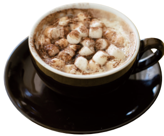
Hot chocolate ホットチョコレート

ピルスナータイプのビールの発祥の地、ブルゼニユの街で生産される不動の人気ビール No.1 brand beer produced in the city of Prusenu where Pilsner-type beers are originated.