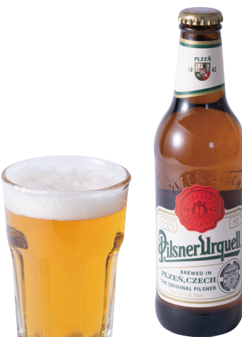
Pilsner Urquell ピルスナーウルケル

キク科の野菜チコリの根の部分を焙煎した、カフェインレスのコーヒー Caffeine-less coffee made by roasted roots of chicory.