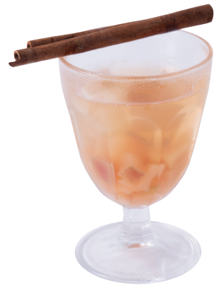
Compote of apple and pear りんごと洋梨のコンポート