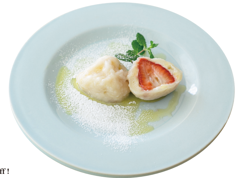
Ovocné knedlíky オヴォツネー・クネドリキー

ビールとの相性も抜群な、老若男女に愛される人気料理 Very popular dish which is the best companion to beer.