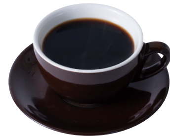
Chicory coffee チコリコーヒー

ヨーロッパの果物の保存法にならない、旬の果物をコンポートにしました Compote of seasonal fruits after the preservation method of fruits in Europe.